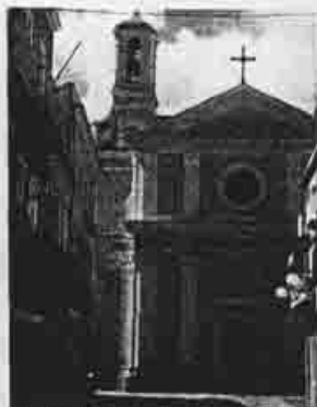
Dall'alto: una chiesa di Carloforte, Isole di San Pietro, il castello dell'Asinara Grandi: il porticciolo della Maddalena

La pagina scritta e l'immagine è il tema di Pensieri e Parole. Un rapporto da sempre assai fertile fra due arti narrative. Non solo letteratura e cinema, dunque, ma uno sguardo agli intrecci fra i diversi media, in un percorso che va dal libro al film e ad altre esperienze visive, per mettere in risalto la relazione fra espressione artistica e competenze tecniche. Quest'anno ci sarà un rapporto più stretto con la Facoltà di Architettura dell'Università di Sassari, per realizzare un master sull'animazione. La Notte dei Cartoons sarà una maratona con i personaggi e le storie più amate dai ragazzi. La Notte della Luna, in un allestimento curato dagli studenti della facoltà di Architettura, proporrà immagini della conquista spaziale del 21 luglio 1969. Infine, Nuovo Carcere Paradiso: le peculiarità ambientali e storiche dell'isola e dell'ex carcere di massima sicurezza di Fornelli, nelle precedenti edizioni del ►